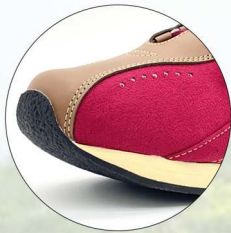
蹴り出しやすく つまずきにくい