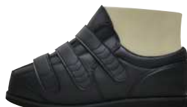
しっかりと履けるんです。