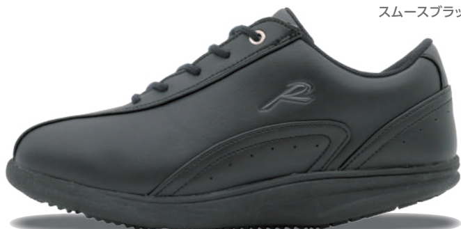
スムースブラック